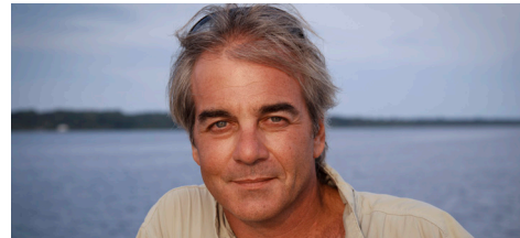
Jean Lemire Biologiste et cinéaste